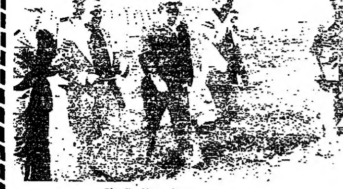
زرق ومرافقه اثناء الجولة